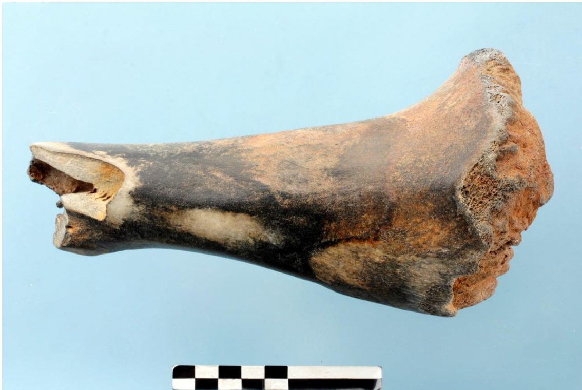
Figuur 3: Bovenste deel van het opperarmbeen van een oerrund, foto: Hans Denis, © Agentschap Onroerend Erfgoed.

Vondsten van edelhert en oerrund zijn moeilijk te dateren omdat die zowel in het Weichseliaan als in het Holoceen voorkwamen. Het edelhert kwam vermoedelijk niet gedurende de aller koudste fasen van de ijstijd voor omdat er toen te weinig voedsel en bebossing was (Kortenbout van der Sluys 1989, 282). De databank maritieme archeologie bevat twee gelokaliseerde vondsten (opperarmbeen en een geweifragment) afkomstig van een edelhert alsook een botfragment van een oerrund ( Bos primigenius ). Het laatste is afkomstig van een oerrund jonger dan 3,5-4 jaar. Een interessant gegeven hierbij is dat er ook duidelijke breukvlakken op het stuk zichtbaar zijn die naar alle waarschijnlijkheid niet natuurlijk maar antropogeen van aard zijn 2 (fig. 3). Het betreft dus wellicht een artefact, een door mensenhanden bewerkt stuk been.