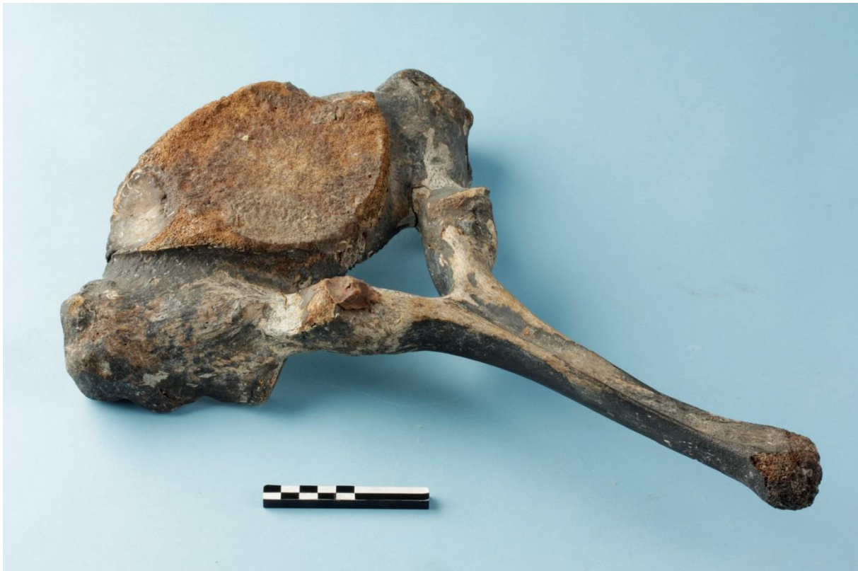
Figuur 1: Mammoet of Bosolifant, borstbeenwervel aangetroffen bij baggerwerkzaamheden in de vaargeul van de haven van Zeebrugge.

Behalve de zopas vermelde vondsten uit het Tigliaan waarvan niet kan bewezen worden dat ze ook in Belgische wateren zijn aangetroffen, zijn de oudste vondsten die met zekerheid uit Belgische Noordzeewateren komen 4 resten van mammoeten ( Mammuthus primigenius ) of bosolifanten ( Elaphus antiquus ) afkomstig van drie verschillende locaties: vaargeul Zeebrugge (fig. 1), vóór de Belgische kust en vóór de kust van Nieuwpoort. Het ontbreken van typerende kenmerken op de 4 vermelde resten maakt een uitsluitende toewijzing aan één van beide zoogdieren niet mogelijk wat verklaart waarom ze als Eem of Weichsel gedateerd worden.