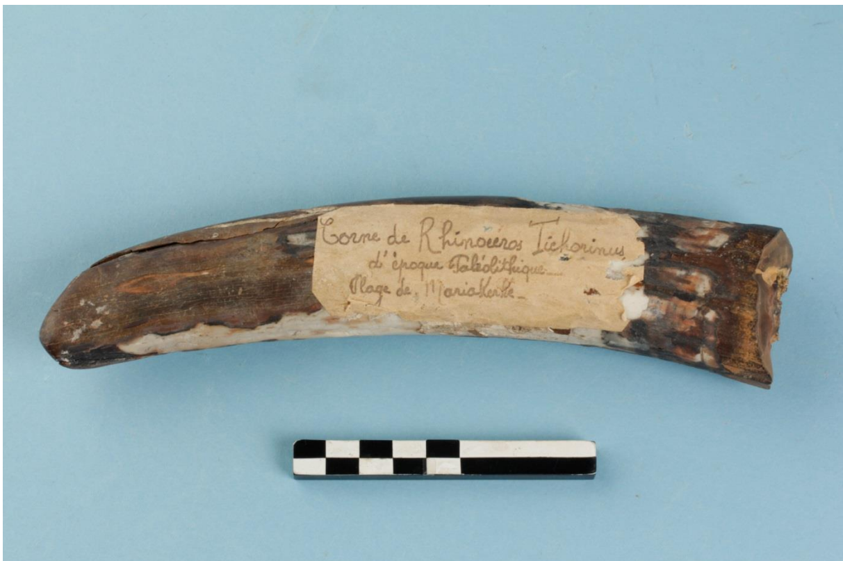
Figuur 2: Walrstandfragment gevonden op het strand van Mariakerke, aanvankelijk verkeerdelijk als neushoorn geïdentificeerd zoals aangegeven op het etiket.